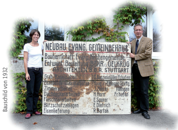
Bauschild von 1932

Falls die Patenschaft Ihrer Wahl bereits vergeben ist, nehmen wir Kontakt mit Ihnen auf und schlagen Ihnen eine Alternative vor.